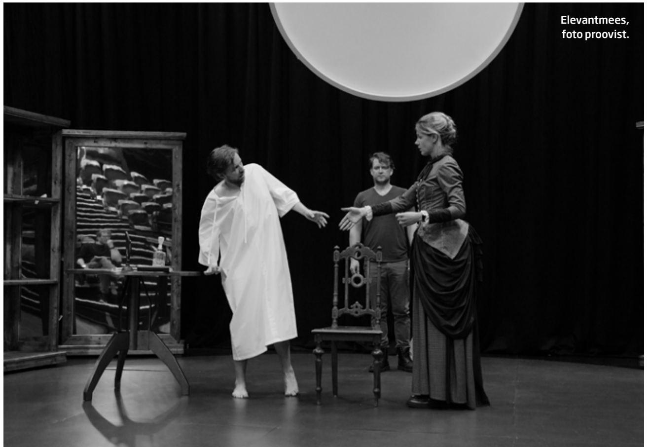
Elevantmees, foto proovist.

Seal oli ikkagi kõik väga naturaalne. Näidendi idee on teine.